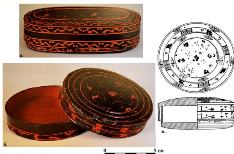
Рис. 4. Лаковые изделия из китайских погребений.