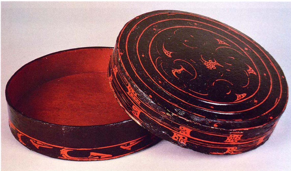
3. 湖北省云梦睡虎地墓地出土漆器复原情况