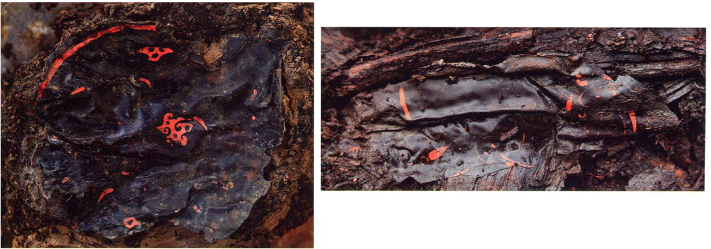
2. 湖北省云梦睡虎地墓地漆器出土情况