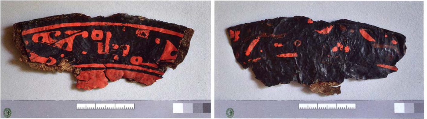
1. 俄罗斯阿尔泰边疆区布格林墓地出土的漆器