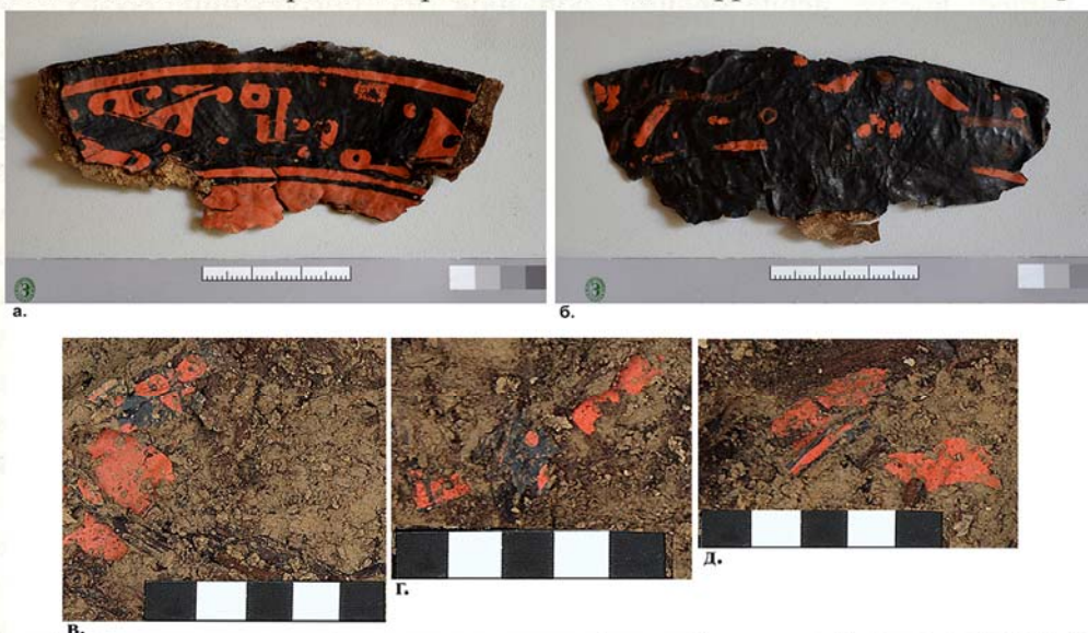
Рис. 1. Фрагмент лаковой чашечки из погребения 3 кургана №1 могильника Бугры:

Работа выполнена в рамках гранта СПбГУ, шифр ИАС 2.38.525.2013.]